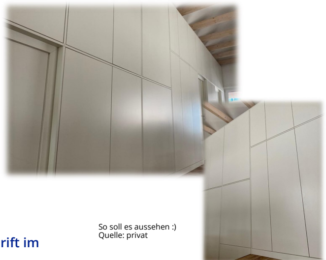
So soll es aussehen :)

(bei Wunsch auf Spendenquittung bitte Ihre Anschrift im „Verwendungszweck“ angeben) Bei einer Spende erhalten Sie von uns eine entsprechende Spendenbescheinigung (Zuwendungsbestätigung). Spenden sind unter bestimmten steuerlichen Voraussetzungen abzugsfähig.