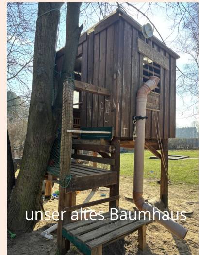
unser altes Baumhaus

Unser altes Baumhaus ist leider in die Jahre gekommen und darf aktuell aus Sicherheitsgründen nicht mehr bespielt werden.